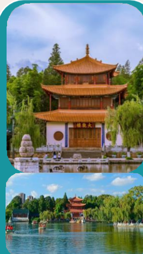
Visita del Cuihu Lake + Military Museum