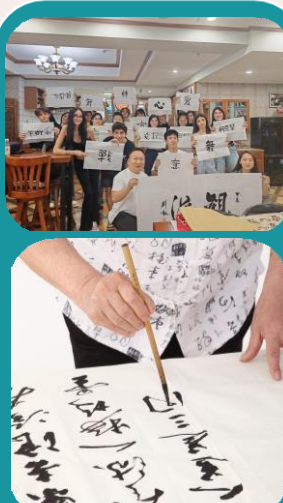
Corso di calligrafia