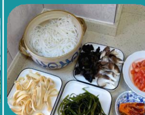
Attività di conversazione al Zhuaxin Farmers Market