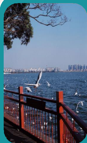
Visita e role- playing Haigeng Park