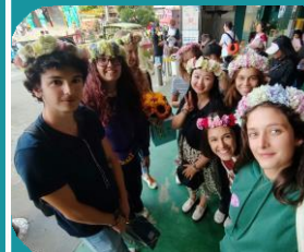
Caccia al Tesoro al Dounan Flower Market