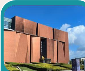
Role-playing presso Yunnan Provincial Museum e Guandu Ancient Town