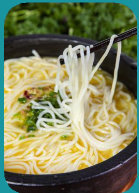
Arrivo a Kunming Cena di benvenuto